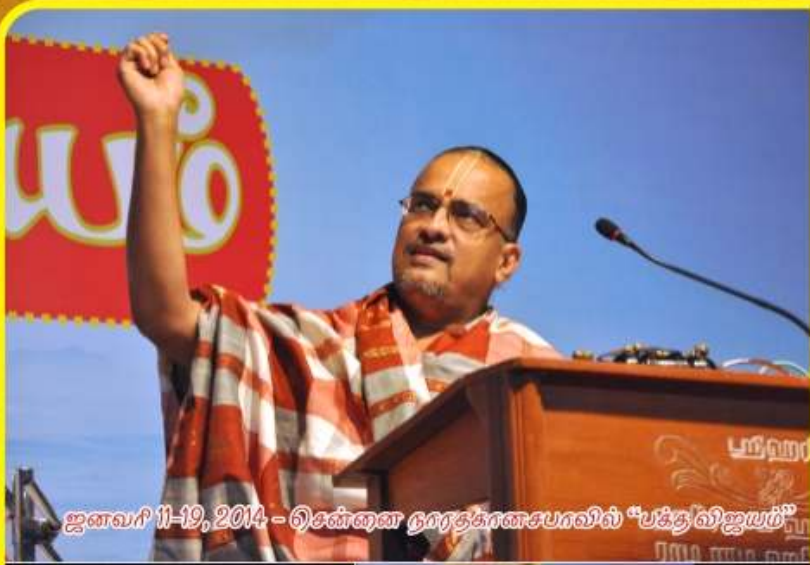
ஜனவரி 11-19, 2014 - ஒசின்னை நகரத்தின்களபகலில் "பக்த்விஜயம்"