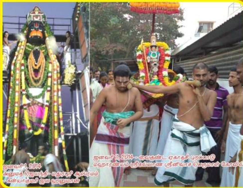
ஜனவரி 1, 2014 அனுமதி ஜெயந்தி-மதராபுரி ஆஸ்பிரயம் -கன்யாகுமரி ஐய வறனுமான்