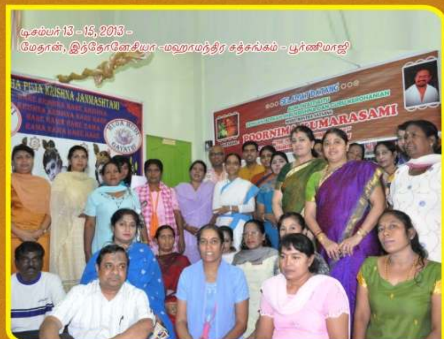
டிசம்பர் 13-15, 2013 - மேதான், இந்தோனேசியா - மஹாமந்திர சத்தசங்கம் - பூர்ணிமாஜி