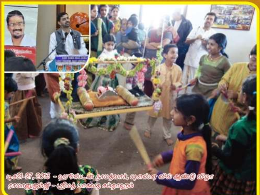
டிசம்பர் 21-27, 2013 - ஹாலிஸ்டன் நாமத்வாரி, யு.எஸ்.ஏ வில் ஆண்டு விழா நாமானுஜம்ஜி - ஸ்ரீமதி பாகவத சத்தாஹம்